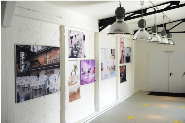
Details wie Bilder und die richtige Beleuchtung tragen zu einer gelungenen Atmosphäre bei

Für Kunden, die viel Wert auf Planungssicherheit legen und mehr wollen als eine computergenerierte Visualisierung, bauen die Mitarbeiter von Party Rent auch völlig individuelle Settings und ganze