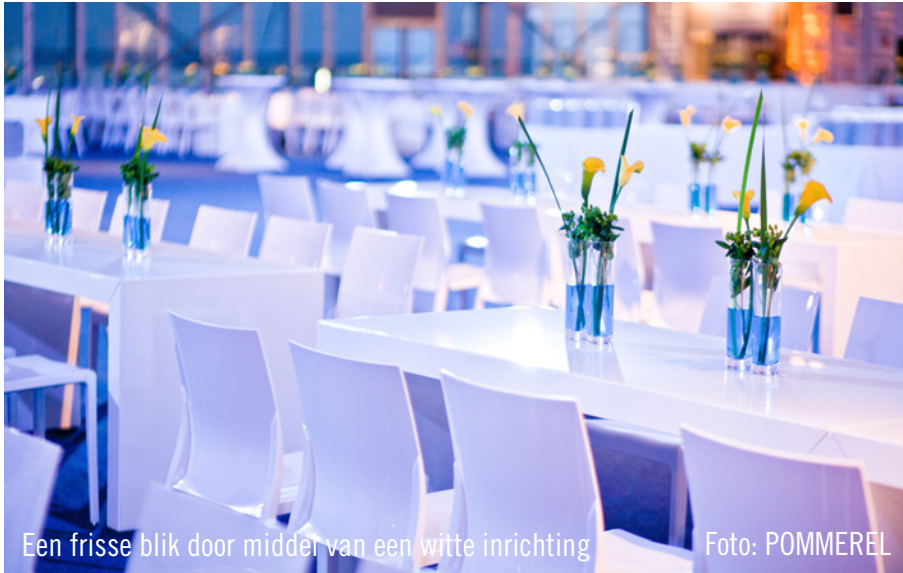
Een frisse blik door middel van een witte inrichting