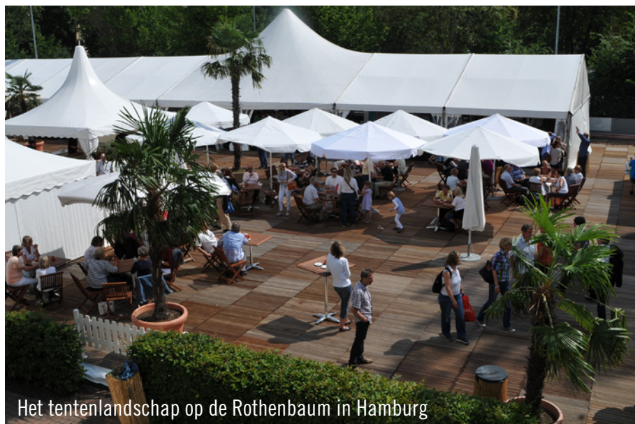
Het tentenlandschap op de Rothenbaum in Hamburg

volop van dit evenement te genieten. Meer dan twintig pagodetenten, een door tenten overdekte winkelstrook van 500m 2 en het V.I.P.-dorp werden door het Party Rent team sfeervol ingericht. Hoewel er nog geruime tijd te gaan is, voordat de eerste service van het toernooi in 2012 wordt geslagen, kijkt het Party Rent team nu al vol verwachting uit naar de eerste tie-break op de Hamburgse Rothenbaum in 2012!