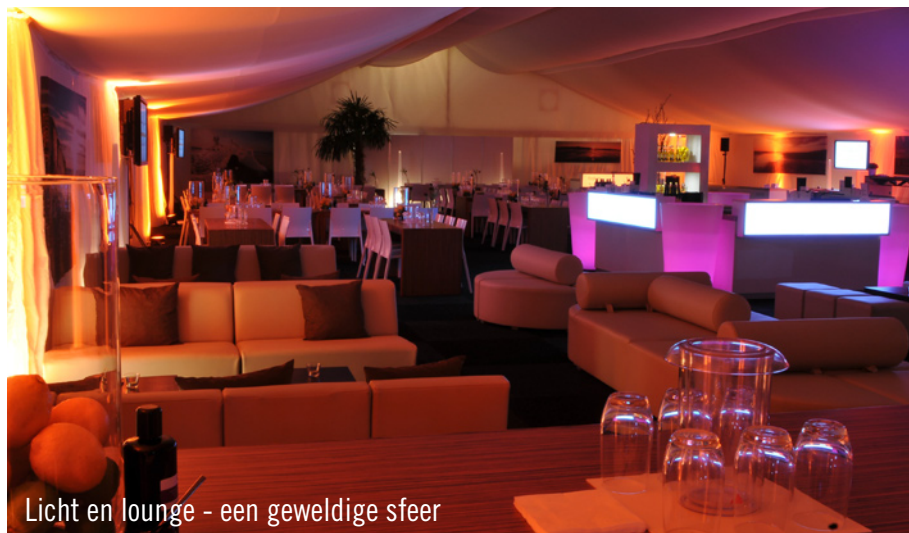
Licht en lounge - een geweldige sfeer

Voor de derde achtereenvolgende keer heeft Party Rent Hamburg de inrichting verzorgd voor het prestigieuze tennis-toernooi “bet-at-home.com Open” in de Hamburgse Rothenbaum. Voor de spelers maar ook voor de tennisliefhebbers draaide deze week alles om de gele vilten bal in het hart van de Hamburgse binnenstad.