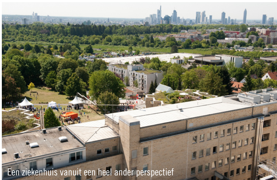
Een ziekenhuis vanuit een heel ander perspectief

Het team van Event & Catering GmbH bracht bijna een week door in het ziekenhuis. Gelukkig puur zakelijk! Deze cateraar verzorgde voor deze kliniek in Frankfurt de openingsceremonie naar aanleiding van de afronding van de nieuwbouw. De feestelijkheden rondom de opening waren verspreid over drie dagen: