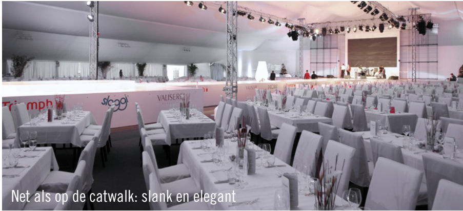
Net als op de catwalk: slank en elegant

In het kader van het 125-jarige jubileum van een internationale onderneming, koos organisatiebureau Nixdorf, Party Rent Stuttgart als partner voor de levering van event-equipment.