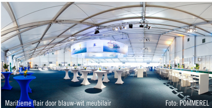
Maritieme flair door blauw-wit meubilair

maritieme sector. De organisatie van deze conferentie was bij Live-Marketing GmbH in goede handen. Wij van Party Rent, herhalen hierbij nog maar eens de woorden van de Duitse bondskanselier mevrouw dr. Angela Merkel, die in haar toespraak op de conferentie iedereen feliciteerde: „...die ervoor gekozen heeft innovatief bezig te zijn, niet alleen voor het „oude bekende“ te kiezen, maar vooral de blik op de toekomst te richten. Een zeer passende uitspraak op deze unieke event-locatie.“