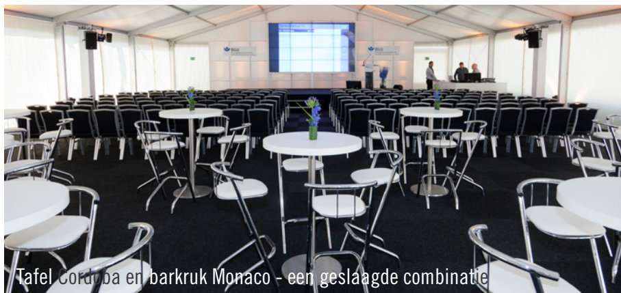
Tafel Cordoba en barkruk Monaco - een geslaagde combinatie

opgebouwde feesttent. Op zondag waren de inwoners van Frankfurt uitgenodigd voor een "Familiëdag". In totaal kwamen er bijna 5.000 bezoekers op af. De bezoekers kregen de mogelijkheid om een blik te werpen achter de schermen van één van de modernste klinieken van Europa. Via de afdeling eerste hulp, de operatie afdeling, de landingsplaats voor helikopters en de sterilisatieafdeling voor operatie apparatuur, leidden de gidsen meer dan 1.450 personen in groepen van 30 rond door het hele gebouw.