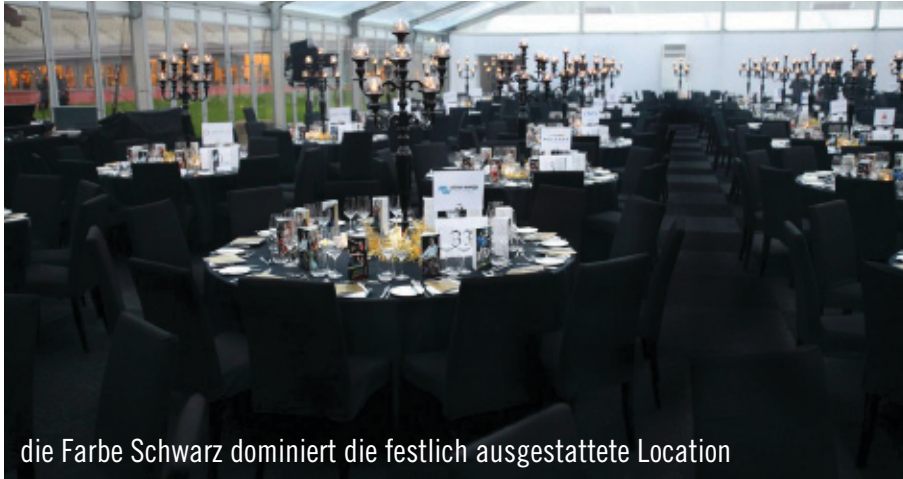
die Farbe Schwarz dominiert die festlich ausgestattete Location

Die einzelnen Party Rent Standorte kommen ihrer gesellschaftlichen Verantwortung mit unterschiedlichen überregionalen und lokalen Engagements nach. So engagierte sich Party Rent Arnheim für die glamouröse Gehandicaptensport Gala, die alljährlich für behinderte Sportler aus den Niederlanden, unter ihnen auch erfolgreiche Teilnehmer der Paralympics, organisiert wird. Im festlich ausgestatteten Olympiastadion in Amsterdam waren weitere namhafte Großunternehmen zu diesem besonderen Anlass geladen, um den Behindertensport zu unterstützen. Die Farbe Schwarz war Thema des Abends. Runde