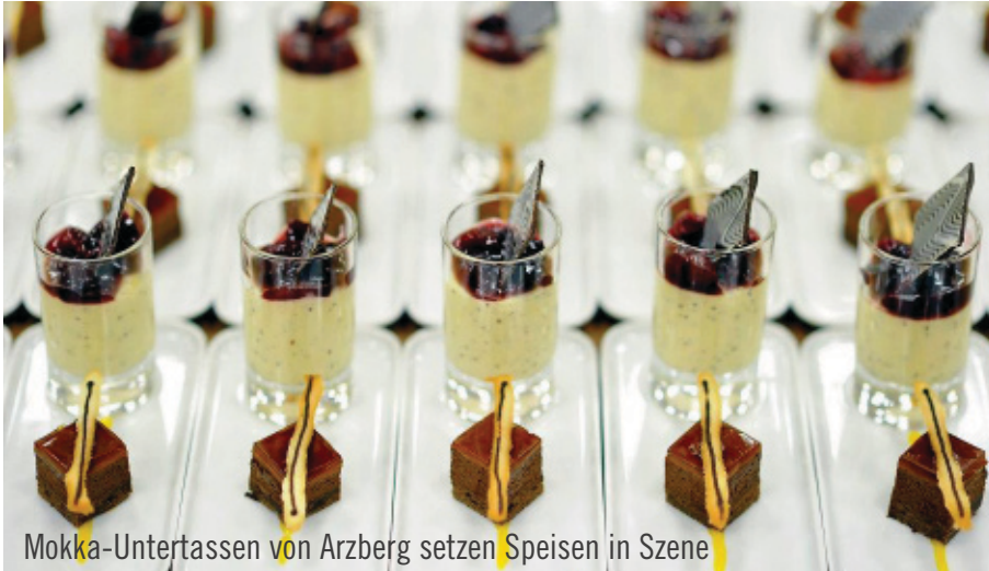
Mokka-Untertassen von Arzberg setzen Speisen in Szene

dinner&co ist bekannt für individuelle Cateringkonzepte und Komplettservices auf höchstem Niveau. Zum Jahresempfang begrüßte der Caterer Top-Kunden sowie Gäste des Orchesterzentrums Dortmund. Um den 250 Geladenen den Abend in dieser Location noch schmackhafter zu machen, wurden kulinarische Hochgenüsse aus stilischem Fingerfood und raffinierten Buffets aus dem eigenen Hause angeboten. Zur Präsentation der Köstlichkeiten wurde auf das Equipment von Party Rent