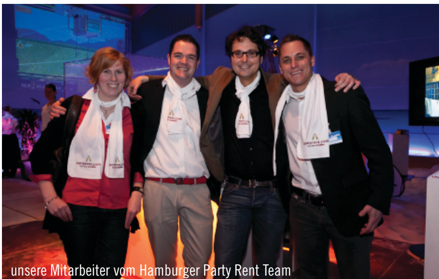
unsere Mitarbeiter vom Hamburger Party Rent Team

Mal fand der Eventpartnerabend unter unserer Mitwirkung statt und wieder einmal war es spannend zu sehen, wie sich eine Veranstaltung kontinuierlich zum festen Bestandteil der Hamburger Veranstaltungsszene weiterentwickelt. Was das nächste Jahr für Innovationen mit sich bringt ist bisher noch ein Geheimnis. Jedoch ist zum jetzigen Zeitpunkt bereits klar: Die Vorfriede der Hamburger Event-Szene auf ihren Branchentreff ist bereits groß!