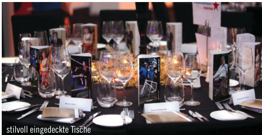
stilvoll eingedeckte Tische

Tische wurden mit schwarzer, bodenlanger Tischwäsche überzogen und Stühle mit schwarzen Hussen versehen. Auf den Tischen erleuchteten Kerzen in 10-armigen schwarzen Kerzenleuchtern. Durch anthrazitfarbene Teppichfliesen wurde das Thema Schwarz abgerundet. An stilvoll eingedeckten Tischen konnten die 500 Gäste die Köstlichkeiten vom Caterer Maitre Frederic genießen. Im Rahmen der Spendengala ist für die behinderten Sportler eine beachtliche Summe an Spendengeldern zusammengekommen, mit der der Behindertensport zukünftig unterstützt wird.