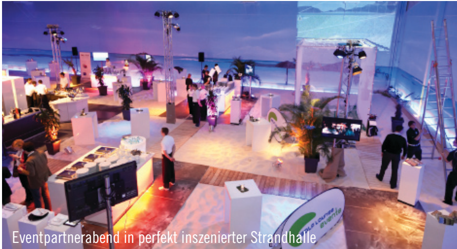
Eventpartnerabend in perfekt inszenierter Strandhalle

Strahlende Gesichter bei eiskalten Temperaturen, mit Flip-Flops durch die letzten Schneeberge auf dem Parkplatz und mit Sonnenbrillen in den Haaren durch die dunkle Abendstimmung: Wie auch im letzten Jahr war die Stimmung und die Atmosphäre beim alljährlichen Event in Hamburg hervorragend. Knapp 600 Gäste tummelten sich in der perfekt inszenierten Strandhalle und führten bei Live-Musik und köstlichen kulinarischen Spezialitäten abwechslungsreiche Gespräche. Bereits zum dritten