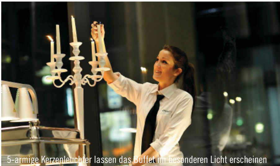
5-armige Kerzenleuchter lassen das Buffet im besonderen Licht erscheinen

Dortmund zurückgegriffen. Mokka-Untertassen und Servierplatten aus der Basic-Porzellanserie von Arzberg halfen dabei, die hochwertigen Speisen in Szene zu setzen – denn schließlich ist das Auge mit. Die Kerzen des 5-armigen Kerzenleuchters ließen die Speisen in einem ganz besonderen Licht erscheinen. Dank der Liebe zur guten Küche, einem eingespielten Team von dinner&co und der Unterstützung von Party Rent wurde der Event für alle unvergesslich.