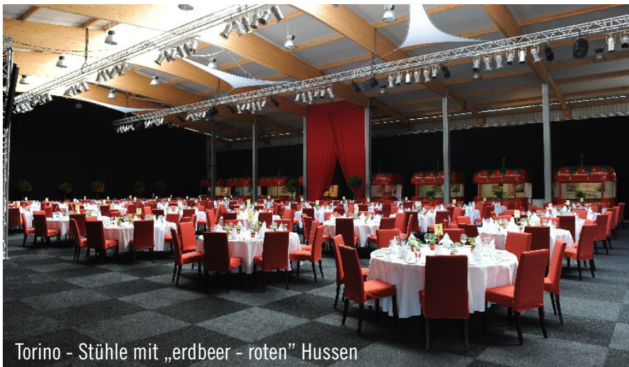
Torino - Stühle mit „erdbeer - roten“ Hussen

Zum Hoffest am Wochenende kamen dann fast 20.000 Besucher, um gemeinsam mit den Jubilaren die Erdbeersaison zu eröffnen.