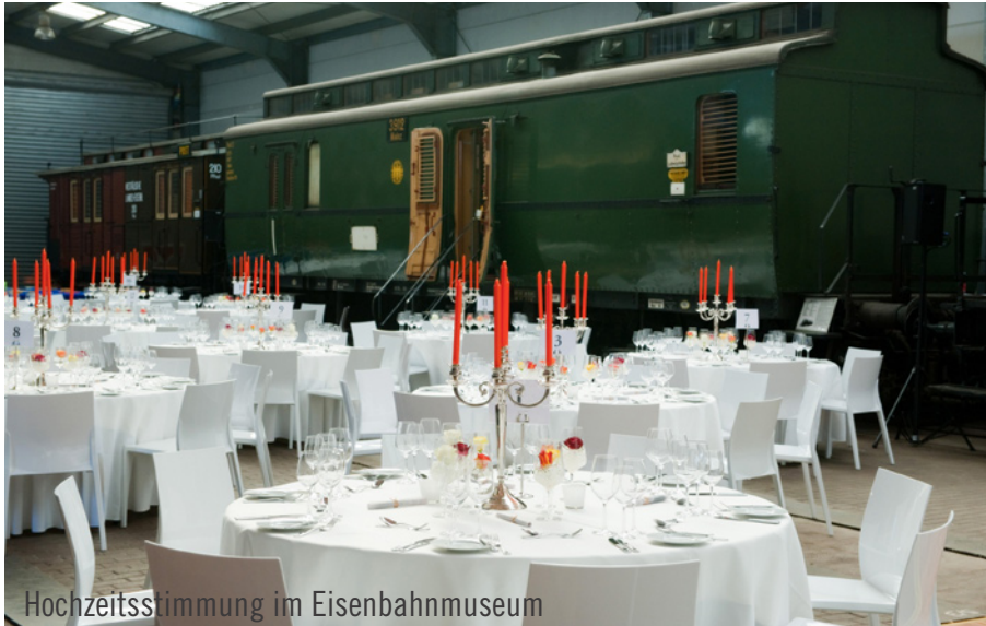
Hochzeitsstimmung im Eisenbahnmuseum

Noi! Event & Catering inszenierte mit Party Rent als Ausstattungspartner eine Hochzeit im Eisenbahnmuseum.