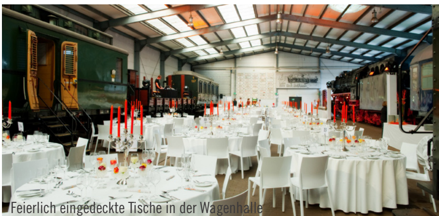
Feierlich eingedeckte Tische in der Wagenhalle

einem Begrüßungs-Umtrunk per Schienenbus (Baujahr 1936) vom Museum aus zum Traugottesdienst geschuttlet. Anschließend ging es auf gleichem Wege wieder zurück ins Museum. Feierlich eingedeckte runde Tische in der Walter-Distelbarth-Halle mit moderner Blumendekoration und die speziell installierte Lichttechnik verwandelten die Wagenhalle in einen großen Bankettsaal. Nach dem Dinner wurde bei Musik und Tanz noch bis in die frühen Morgenstunden gefeiert. Thank you for travelling, Eisenbahnmuseum!