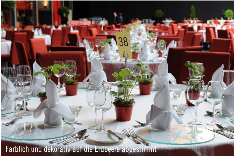
Farblich und dekorativ auf die Erdbeere abgestimmt

Zum 50-jährigen Bestehen des Erdbeerhofes feierte Familie Glantz mit 350 geladenen Gästen ein grandioses Fest. Dafür wurde die riesige Halle, in der normalerweise die Ernteprodukte gestapelt werden, für das große Gala-Dinner mit Erdbeeren und Spargel umgestaltet.