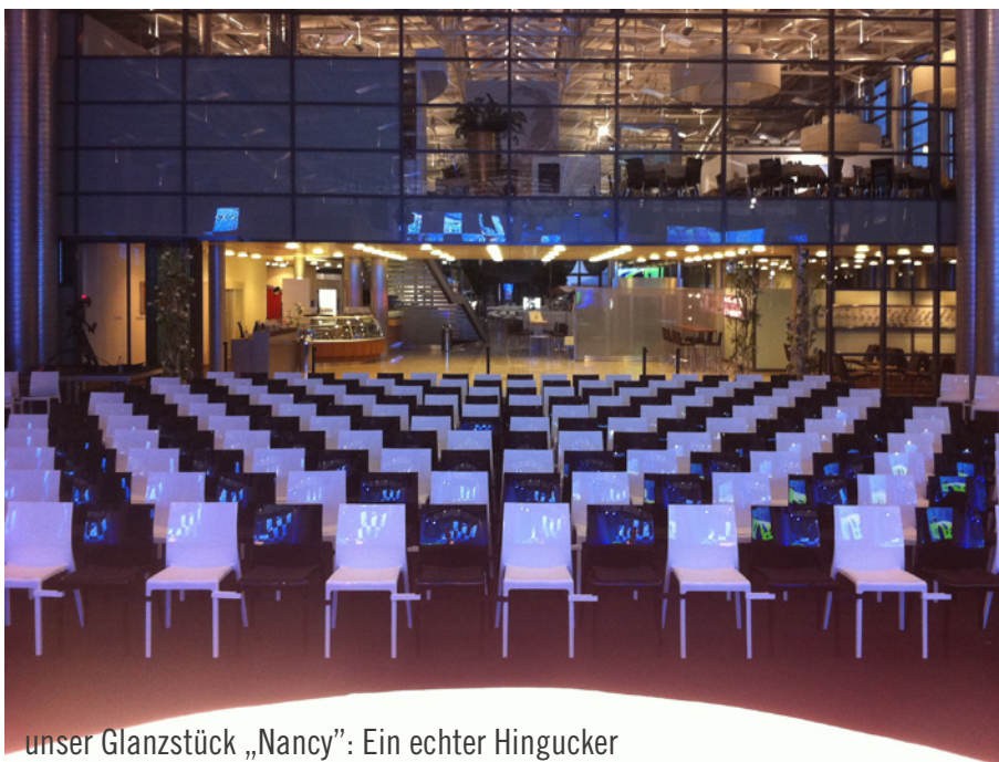
unser Glanzstück „Nancy”: Ein echter Hingucker

Für Kenner der Automobilszene ein besonderer Hingucker, denn aus dieser besagten Palette setzt sich das Produktionsportfolio des Bremer Mercedes-Benz Werks zusammen: Hierzu gehört der Geländewagen der Serie GLK, das E-Klasse Coupé und das dazugehörige Cabrio sowie die Limousine und das T-Modell der C-Klasse. Selbstverständlich dürfen die schnittig sportlichen Modelle SL und SLK zur Vollendung nicht fehlen. Ebenso schnittig ging es im Saal weiter, in dem die Gäste zu feierlichen Festreden auf unseren ebenfalls in schwarz-weiß ausgerichteten Nancy-Designerstühlen lauschten. Köstliche Schlemmereien unseres Cateringpartners, der Sarah Wiener GmbH, aus diversen Jahrzehnten deutscher Automobilgeschichte, verzauberten den Gästen den Gaumen und luden zum Verweilen ein. 125 Jahre Automobil in Bremen: Ein wahrhaft festliches Prosit!