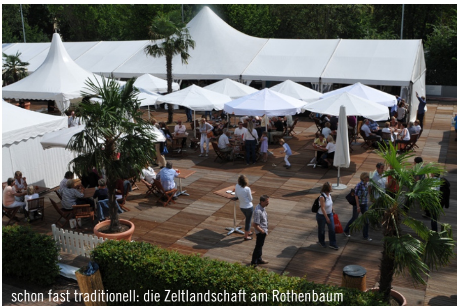
schon fast traditionell: die Zeltlandschaft am Rothenbaum

Bis zum nächsten Aufschlag im kommenden Jahr vergehen zwar noch einige Tage, aber unsere Vorfreude auf den ersten Tie-Break am Hamburger Rothenbaum im Jahre 2012 ist jetzt schon groß!