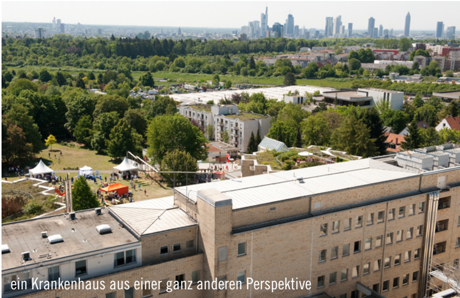
ein Krankenhaus aus einer ganz anderen Perspektive

Das gesamte noi!-Team war fast eine Woche im Krankenhaus – zum Glück aber nur rein dienstlich! noi! Event & Catering unterstützte die Berufsgenossenschaftliche Unfallklinik Frankfurt a.M. bei der Einweihung des Klinikneubaus. Über drei Tage erstreckten sich die Eröffnungsfeierlichkeiten: