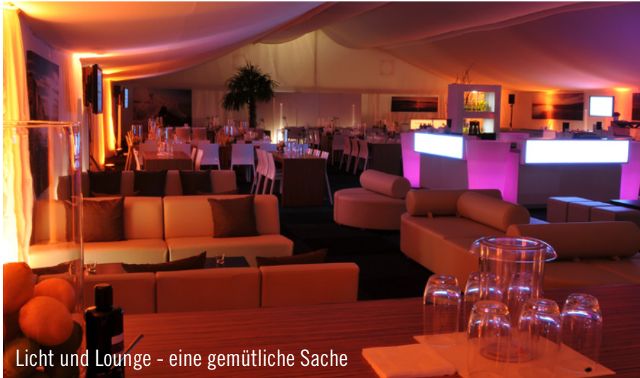
Licht und Lounge - eine gemütliche Sache

Bereits zum dritten Mal hatte Party Rent Hamburg die Gelegenheit, die bet-at-home.com Open am traditionellen Hamburg Rothenbaum im Auftrag von der HSE zu betreuen.