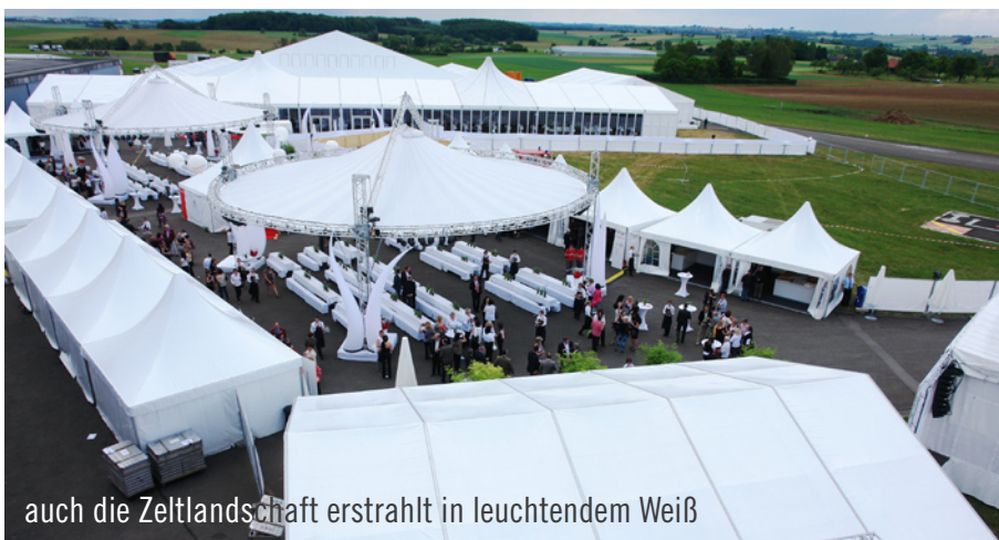
auch die Zeltlandschaft erstrahlt in leuchtendem Weiß