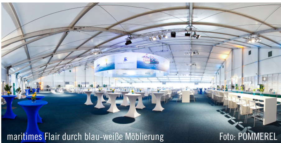
maritimes Flair durch blau-weiße Möblierung

die Leitveranstaltung für die deutsche maritime Wirtschaft, stattfinden. Die Gesamtorganisation dieser Konferenz lag bei POMMEREL Live-Marketing in den besten Händen. Wir können unserer Bundeskanzlerin Frau Dr. Angela Merkel nur zustimmen, die in ihrer Grundsatzrede auf der Konferenz allen gratulierte: „...die sich entschieden haben, einfach mal etwas Neues zu wagen, nicht in eine klassische Halle zu gehen, sondern in die Zukunft zu blicken. Ein passender Austragungsort.“