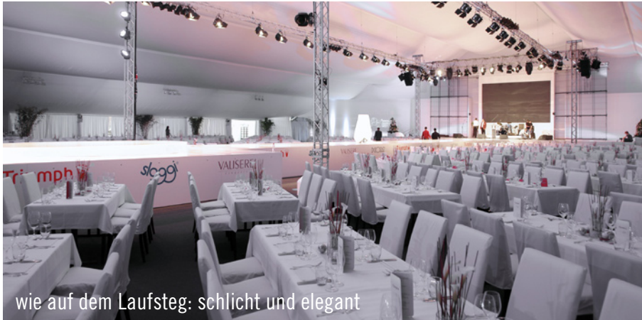
wie auf dem Laufsteg: schlicht und elegant

Im Rahmen des 125-jährigen Jubiläums für ein internationales Unternehmen im Ostalbkreis wählte die Agentur Nixdorf Veranstaltungen Party Rent Stuttgart als Partner für den Bereich Event-Equipment.