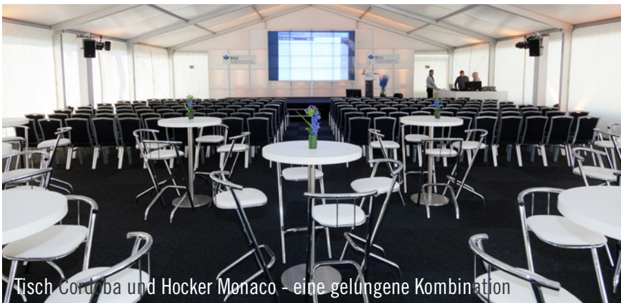
Tisch Cordoba und Hocker Monaco – eine gelungene Kombination

BGU die Frankfurter Bevölkerung zum »Familihtag der offenen Tür« eingeladen – und fast 5.000 Besucher kamen. Es bestand unter anderem die Möglichkeit, einen Blick hinter die Kulissen einer der modernsten Kliniken Europas zu werfen. Über die Notfallaufnahme, den OP-Bereich, den Hubschrauberlandeplatz und die Sterilisationsabteilung für OP-Geräte bzw. -Instrumente führten die noi!-Guides im Zehn-Minuten-Takt über 1.450 Personen in 30er-Gruppen quer über das neue Gebäude.