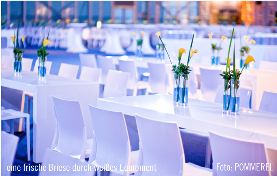
eine frische Brise durch weißes Equipment