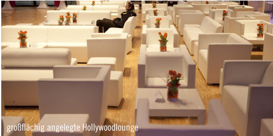
großflächig angelegte Hollywoodlounge

Nach erfolgreicher Fusion der Stuttgarter Volksbank mit der Volksbank Rems lud die neue Volksbank Stuttgart eG ihre mehr als 1.000 Mitarbeiter zu einer Feier ein. Für das Konzept wurde sehr frühzeitig Party Rent Stuttgart mit ins Boot geholt und übernahm die komplette Abwicklung des Aufbaus. Mit klassischen Helsinki-Stehtischen mit Stretchhuse, weißen Brückentischen mit weißen Bonello-Barhockern und einer großflächig angelegten Lounge wurde die Location ausgestattet. Nicht zu vergessen die Buffettheken, auf denen die Köstlich-