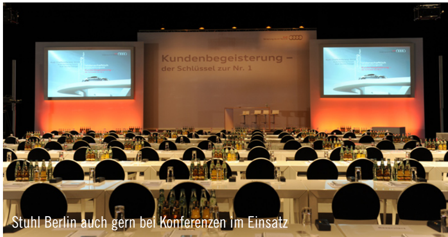
Stuhl Berlin auch gern bei Konferenzen im Einsatz

Für Geschäftsführer, Filialleiter, Verkaufsleiter und Marketingverantwortliche der Audi AG fand im Studio Berlin Adlershof die Audi Chefkonferenz und das Audi Marketing Forum 2010 statt. Am Folgetag wurden Serviceleiter und Teiledienstleister geladen. Je Tag nahmen rund 300 Mitarbeiter teil. Sie erhielten Fachinformationen sowie ausreichend Raum für einen Erfahrungsaustausch unter Kollegen. Für komfortable Sitzmöglichkeiten während der Tagungen sorgte das Team von Party