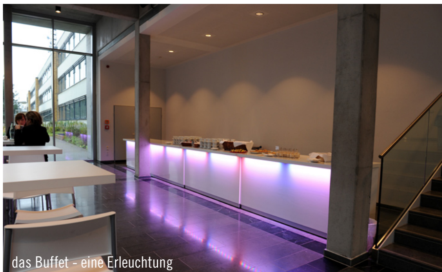
das Buffet – eine Erleuchtung

Rent Berlin. Zur 2-Tages-Veranstaltung nahmen die Teilnehmer in parlamentarischer Anordnung an Brückentischen und auf den Stühlen Berlin Platz, die mit schwarzen Sitz- und Rückenlehnenbezügen versehen waren. Für das leibliche Wohl wurde auch gesorgt. Auf Leuchttheben aus dem Party Rent Sortiment wurde ein reichhaltiges Buffet serviert. Ibiza-Tische und Bonello-Hocker boten den Gästen einen kommunikativen Aufenthalt während des Essens.