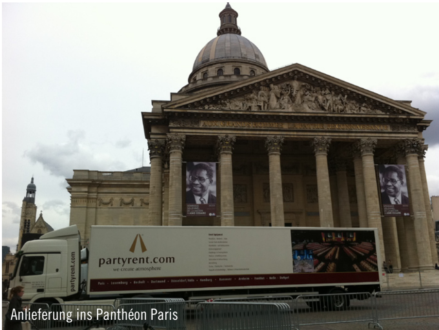
Anlieferung ins Panthéon Paris

Anlässlich der nationalen feierlichen Würdigung von Aimé Césaire, ein französischer Schriftsteller, der 2008 im Alter von 94 Jahren starb, beauftragte die Agentur SHORTCUT Party Rent Paris mit der Ausstattung. Im Panthéon, der nationalen Ruhmhalle Frankreichs und der Grabstätte berühmter französischer