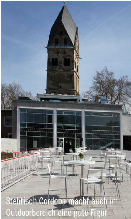
Stehtisch Cordoba macht auch im Outdoorbereich eine gute Figur

Die Fritz Thyssen Stiftung bezog nach einer über zwei Jahre andauernden Umbau- und Sanierungsphase ihre neue Geschäftsstelle, das ehemalige Kölner Amerika Haus. Anlässlich der feierlichen Eröffnung waren über 400 Gäste aus Wirtschaft, Wissenschaft und Politik geladen.