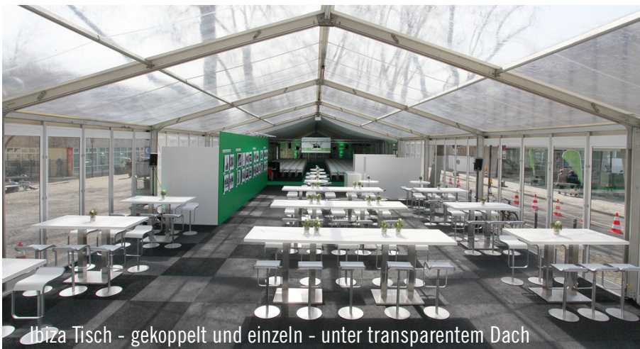
Ibiza Tisch - gekoppelt und einzeln - unter transparentem Dach

Einem Vortragsraum mit lichtundurchlässigem Dach und Seiten sowie einem lichtdurchfluteten Ausstellungs- und Aufenthaltsbereich mit transparentem Dach und Seiten. Zum Vortrag nahmen alle Gäste unter einem weißen Innenhimmel auf den Designerstühlen Cuba Platz. Die geradlinigen Ibiza-Tische kamen im Aufenthaltsbereich zum Einsatz - an den Zeltwänden als Einzeltisch, in der Mitte mit Verbindungsklammern als Doppeltisch. Egal ob einzeln oder aneinandergereiht: Der weiße Designerbarhocker LEM machte stets eine gute Figur. Vor einer mit Halogen-Spots beleuchteten Präsentationswand rundeten die neuen Stehtische Cordoba das Gesamtbild ab. Die von Party Rent eingebauten Heizungen trugen dafür Sorge, dass die Gäste in warmer Atmosphäre die Feier genießen konnten.