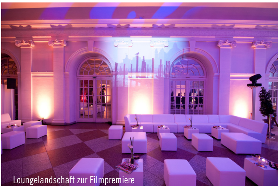
Loungelandschaft zur Film Premiere

Zur Film Premiere im Sony Center lieferte das Aufbauteam neben einigen Zelten auch diverses Mobiliar. Die anschließende After-Show-Party in der Orangerie wurde ebenfalls von Party Rent Berlin ausgestattet. Die Agentur Wilde Beissel von Schmidt GmbH entschied sich für die beliebte Kombination von Brückentischen mit Bonello-Hockern in weiß aus dem Party Rent-Sortiment. Die gemütlich eingerichteten Loungegruppen mit ebenfalls weißem Hollywood-Mobiliar boten nicht nur den Hollywood-Stars Platz zum gemütlichen Verweilen, auch den zahlreich geladenen Gästen. Nach der Premierenvorführung und der anschließenden After-Show-Party erhielt der Film tosenden Applaus. Auch das Team vom Berliner Party Rent-Standort erntete positive Kritiken.