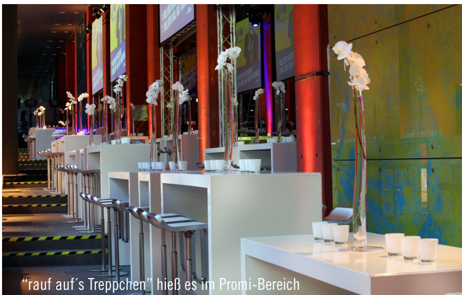
„rauf auf's Treppchen“ hieß es im Promi-Bereich

gegenüberliegenden Henkelmännchen Restaurant und der daran angrenzenden Magistrale bis in die frühen Morgenstunden. Im Auftrag von McFit verantwortete Party Rent Düsseldorf/Köln die Ausstattung der Räumlichkeiten und sorgte mit modernem Equipment für eine sportliche Atmosphäre. Vitali Klitschko bleibt zusammen mit seinem Bruder Wladimir die Nummer eins im Ring – Party Rent die Nummer eins als Ausstattungspartner.