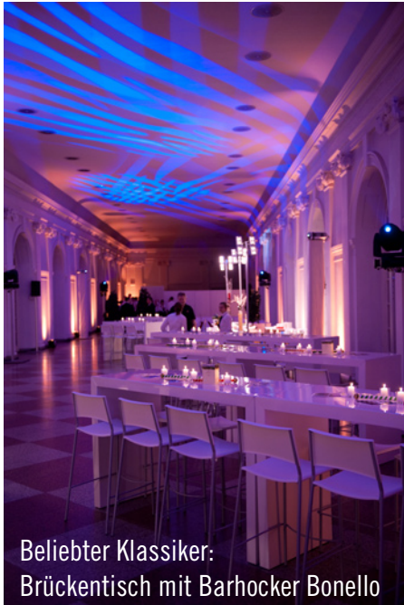
Beliebter Klassiker: Brückentisch mit Barhocker Bonello

Im Dezember 2010 feierten Angelina Jolie und Johnny Depp in Berlin die Europapremiere ihres Films „The Tourist“. Auch Regisseur und Oscar-Preisträger Florian Henckel von Donnersmarck schritt am Potsdamer Platz über den roten Teppich.