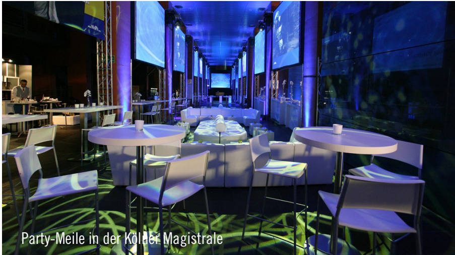
Party-Meile in der Kölner Magistrale

Am 19. März 2011 wurde Box-Weltmeister Vitali Klitschko erneut in den Boxring gebeten. Der 39-Jährige kämpfte in der Kölner LANXESS arena gegen seinen Herausforderer Odlanier Solis. Nach nur drei Minuten war das Duell im Schwergewicht beendet. Umso länger dauerte dafür die anschließende After-Show-Party. Europas größte Fitnessstudio-kette McFit nutzte den medialen Sportevent dazu, sein 1.000.000stes Mitglied zu zelebrieren. Die Gäste feierten im