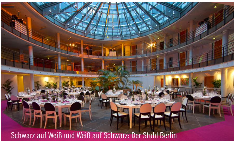
Schwarz auf Weiß und Weiß auf Schwarz: Der Stuhl Berlin

Stühle und 30 moderne Toscano-Tische die Räumlichkeiten der Luxemburgischen Bank. Unter einer Glaskuppel zeigte das Mobiliar glanzvolle Wirkung. Darüber hinaus lieferte Party Rent Luxemburg das Table Top sowie zahlreiches Küchenequipment. Auch im achten Jahr zeigten sich alle Verantwortlichen sowie die 300 geladenen Gäste zufrieden und freuen sich schon auf eine Zusammenarbeit in 2012.