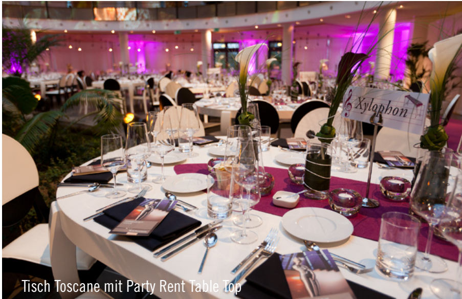
Tisch Toscano mit Party Rent Table Top

... ihre alljährliche Jahreshauptversammlung ausrichtet, muss es immer eine rundum gelungene Veranstaltung werden. Nicht umsonst wird schon seit 2004 volles Vertrauen in die Dienstleistungen von Party Rent Luxemburg gesetzt. Jahr für Jahr lieferte das Party Rent Team modernes Equipment – so auch in diesem Jahr. Beauftragt vom Caterer Gourmet Wagner aus Mayen schmückten 300 schwarz weiße Berlin-