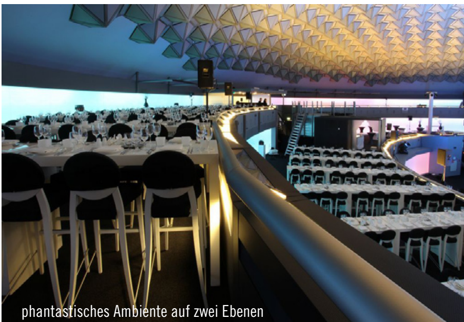
phantastisches Ambiente auf zwei Ebenen

GmbH hat die einzigartige Eventlocation ebenfalls genutzt und 300 Gäste geladen. Die von Party Rent Arnheim errichteten Lounge-Bereiche sowie die eingesetzten Brückentische mit den modernen Designhockern Kopenhagen schmückten den Innenbereich des Evoluon prachtvoll aus.