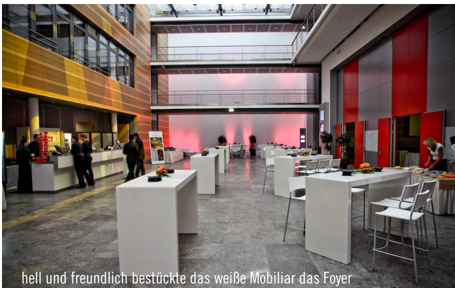
hell und freundlich bestückte das weiße Mobiliar das Foyer

Am 08. Oktober feierte das Meliá Berlin in den Räumlichkeiten des „dbb Forum“ sein viertes Jubiläumsjahr. Zur feierlichen Atmosphäre trug auch die Party Rent Ausstattung über mehrere Etagen bei. Weißes Mobiliar füllte den lichtdurchfluteten Raum und lud die Gäste zum Feiern ein. Die Party Rent Group gratuliert herzlichst zum Jubiläum und freut sich auf eine weiterhin gute Zusammenarbeit.