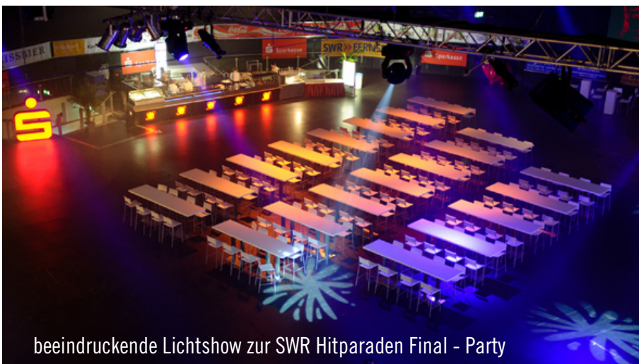
beeindruckende Lichtshow zur SWR Hitparaden Final - Party

Das Organisationsteam der Veranstaltungsgesellschaft in Stuttgart krönte den arbeitsreichen Einsatz mit dankenden Worten: „Wir sind immer wieder beeindruckt, mit welchem Elan und hohem Dienstleistungsgrad das Party Rent Team überrascht. Wir danken dem Team für den unermüdlichen Einsatz rund um diese gelungene Veranstaltung und freuen uns auf weitere gemeinsame Events.“