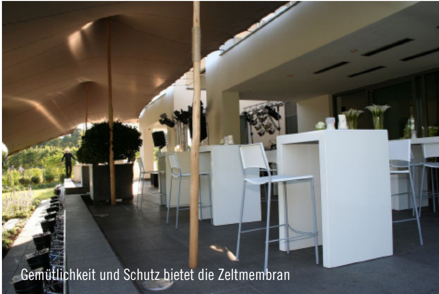
Gemütlichkeit und Schutz bietet die Zeltmembran

Wenn ein neues Haus gebaut, die Hausdame 50 wird und die Tochter aus Argentinien zurückkehrt, sind das gleich drei gute Gründe, ein großes Fest zu feiern. So dachte auch eine niederländische Familie aus Winterswijk und lud zu einer feinen Gartenparty ein.