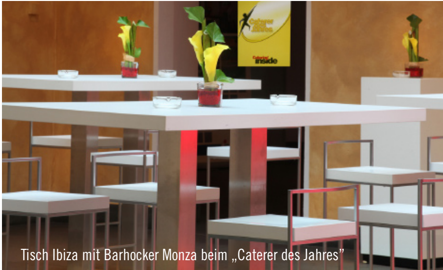
Tisch Ibiza mit Barhocker Monza beim „Caterer des Jahres“

Am 12. September wurde im „Altes Zeughaus Neuss“ der renommierte Branchen-Award „Caterer des Jahres“ verliehen.