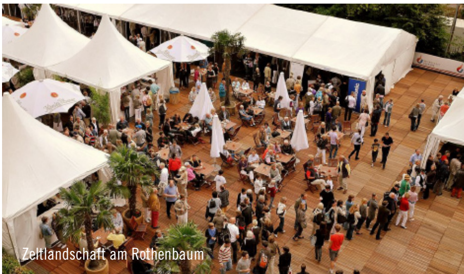
Zeltlandschaft am Rothenbaum