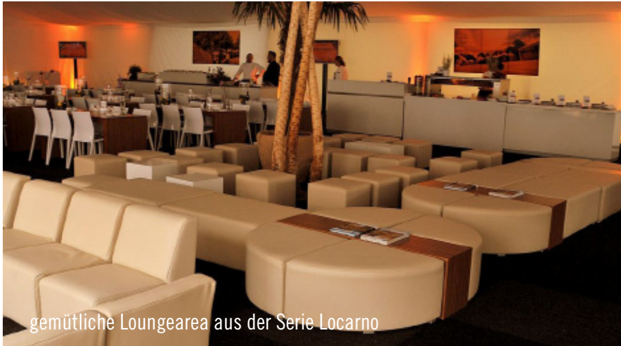
gemütliche Loungearea aus der Serie Locarno

Vom 17. bis 25. Juli wurde erneut auf den German Open Championship 2010 am Hamburger Rothenbaum, einem der traditionsreichsten Turniere der Welt, der Tennisball geschlagen. Sensations-sieger wurde der 23-jährige Andrey Golubev, der sich vor 7.500 Zuschauern im Endspiel gegen den Österreicher Jürgen Melzer durchsetzte und seinen ersten Turniersieg auf der ATP World Tour feierte. Neben den Tennis-Cracks erbrachte auch das Hamburger Party Rent Team eine sensationelle Leistung.