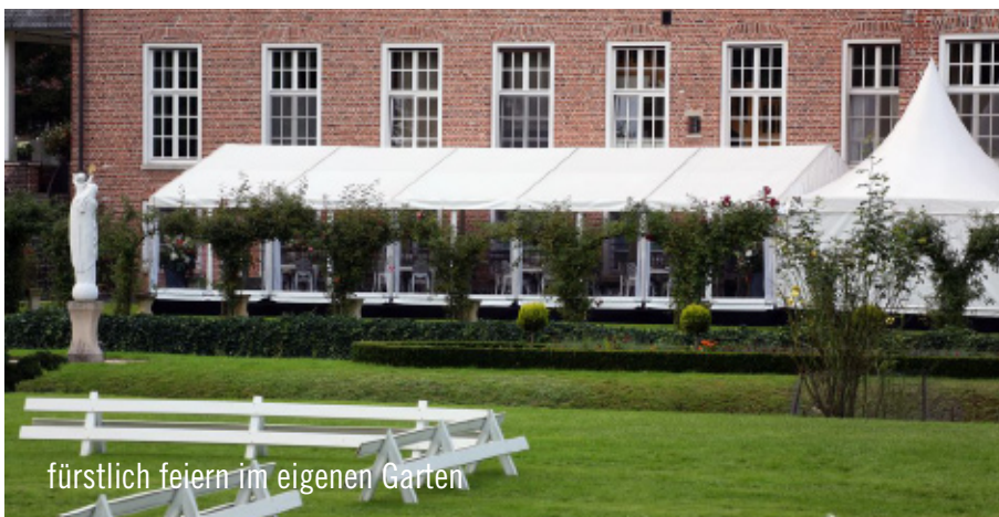
fürstlich feiern im eigenen Garten

Eingedeckt wurden die weißen Tische „Toscane“ mit handgefertigtem Porzellan der Designerin Stefanie Hering, massiv versilbertem Besteck von Robbe & Berking sowie mundgeblasenen Weingläsern von Schott Zwiesel. Die mit Sitz- und Rückenlehnenbezügen eingesetzten Stühle Berlin rundeten das elegante Gesamtbild in der temporären Veranstaltungslocation ab.