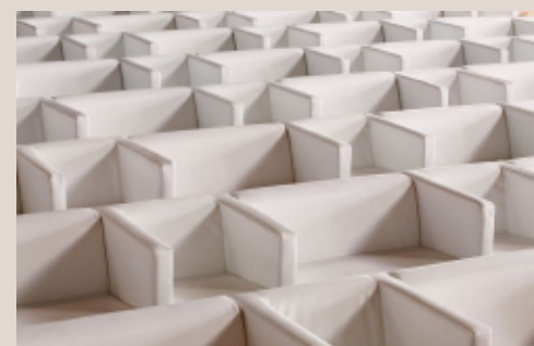
“loungen” mal anders - in Reihe

Der markante Stuhl Jo erfreut nicht nur das Auge. Mit einem Achsmaß von 53,5 cm begeistert der Polsterstuhl jeden, der komfortabel einem Vortrag lauschen möchte.