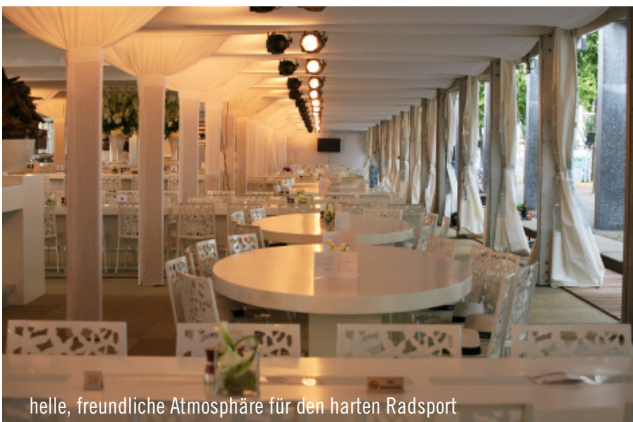
helle, freundliche Atmosphäre für den harten Radsport

stattung an die Gegebenheiten farblich anzupassen. Mit neuen roten Loungekissen wurden die Hollywood-Möbel in das Farbkonzept integriert. Vor dem Zelt wurde eine 90m lange Terrasse mit Holzstühlen und weißen Riesenschirmen errichtet. Die Gäste saßen nur wenige Meter von der Strecke entfernt. Sie konnten von hier aus den Fahrtwind der Fahrer spüren und live miterleben, wie sie die Zieleinfahrt durchfuhren.