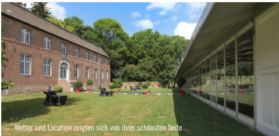
Wetter und Location zeigten sich von ihrer schönsten Seite