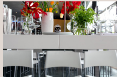
Koppelstücke für den Ibiza-Tisch

Ab sofort können unsere Lounge-Möbel auch mit Kissen gemietet werden. Erhältlich sind diese in unterschiedlichsten Farben, so dass jede Farbstimmung individuell berücksichtigt werden kann.