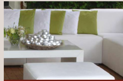
ein Farbtupfer für unsere Lounges

Ab sofort können unsere Lounge-Möbel auch mit Kissen gemietet werden. Erhältlich sind diese in unterschiedlichsten Farben, so dass jede Farbstimmung individuell berücksichtigt werden kann.