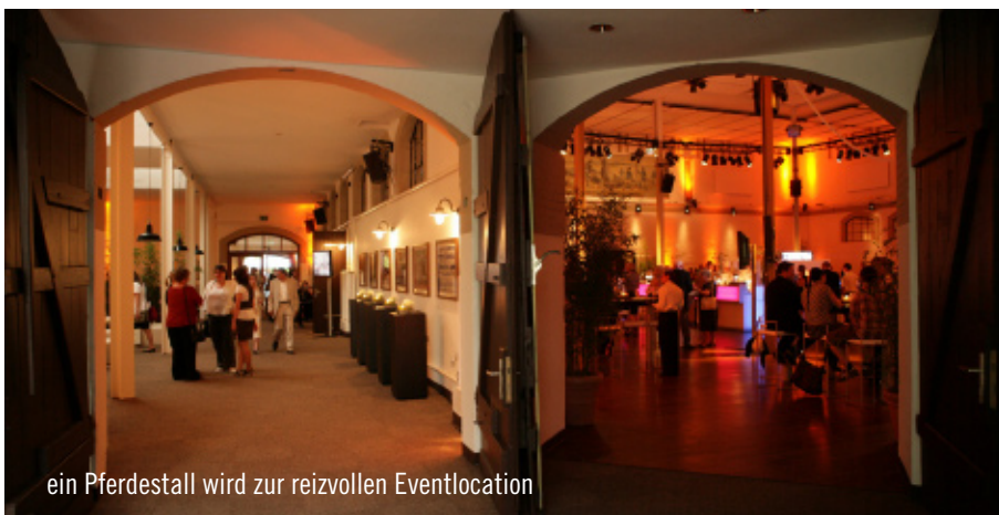
ein Pferdestall wird zur reizvollen Eventlocation

Neben den international ausgerichteten Speisen überzeugte während der Eröffnungsfeier auch Party Rent Hamburg mit stilvollem Mobiliar und Table Top. Ton in Ton standen die schlichten Holzkuben neben den aufgearbeiteten Stallungstüren. An runden mit weißer Tischwäsche überzogenen Tischen ließen sich die 300 geladenen Gäste in freundlich heller Atmosphäre die von Stockheim Catering gereichten kulinarischen Köstlichkeiten schmecken.